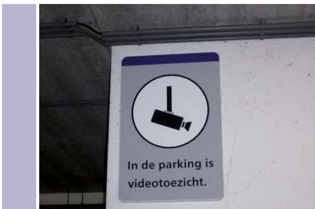
Parkeergarage Vlaardingen cameratoezicht

Wanneer komt er hulp bij calamiteiten? Worden de camera-beelden live gevolgd? Het Platform vindt dat bemande parkeergelegenheden de veiligheid bevorderen. Bij de helft van de onderzochte parkeergelegenheden is het slecht gesteld met de bemanning. Hier zit niemand bij de in- of uitgang, het personeel heeft geen zicht op de betaalautomaten, er is geen kantoortje in de garage te vinden of er staat niet aangegeven waar het kantoor zich bevindt. Gezien de forse tarieven is dit onbegrijpelijk.