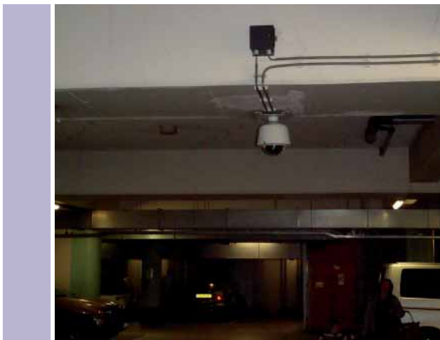
Parkeergarage De Kolk: Hoe donker kan het zijn?

Een ruime meerderheid van de parkeergelegenheden is goed verlicht (zie Bijlage 2). Hier zijn geen donkere hoeken te vinden en de plekken waar betaald moet worden zijn voldoende verlicht. Een paar parkeergelegenheden springen er negatief uit: de Dam en Gelderlandplein in Amsterdam, de Torenlaan in Assen, de Megastores in Den Haag en de Rozenhof in Zaandam. Waar vorig jaar de Orlando Passage in Kerkrade slecht scoorde is nu d'r Pool in Kerkrade ook maar matig verlicht. De matige verlichting van deze garages is slecht voor het veiligheidsgevoel.