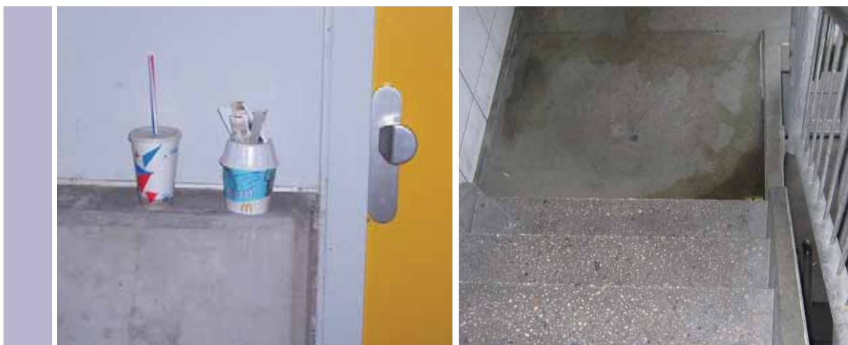
Te weinig vuilnisbakken en urine in het trappenhuis

Als men vervolgens niet frequent schoonmaakt laat dat een zeer onprettige indruk achter. Het Platform Detailhandel Nederland doet dan ook een oproep om frequenter het zwerfafval op te ruimen.