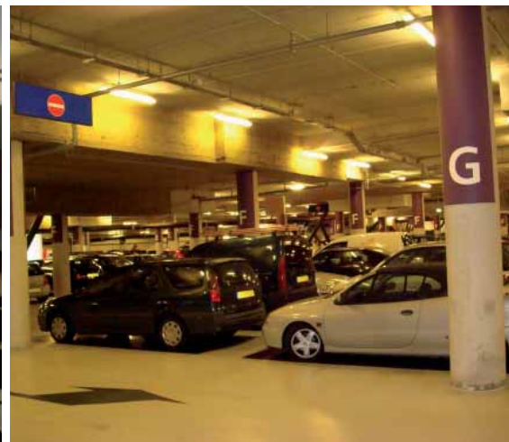
Parkeergarage Almere: Goede verlichting.