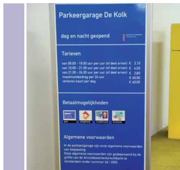
Parkeergarage De Kolk: De duurste garage van Nederland!