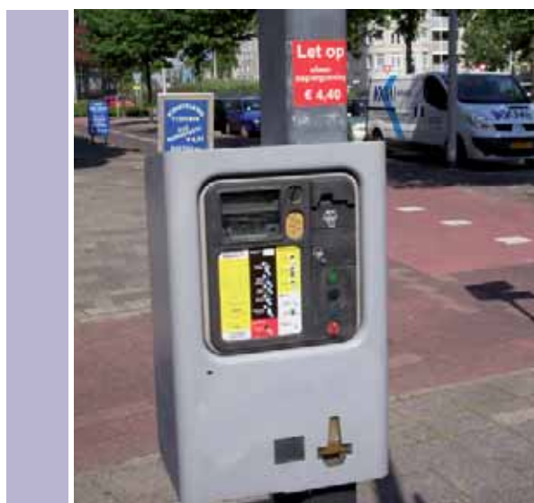
Parkeergarage Vlissingen: Van 1 euro per dag naar 4,40.

De duurste parkeergelegenheden liggen in de vier grote steden: Amsterdam, Den Haag, Rotterdam en Utrecht. Een aantal kleinere steden zoals Apeldoorn, Den Bosch, Kerkrade, Leiden en Nijmegen volgen direct hierna. Hier gelden uurtarieven van meer dan € 2,00. Amsterdam steekt in negatieve zin af met tarieven boven de € 3,50.