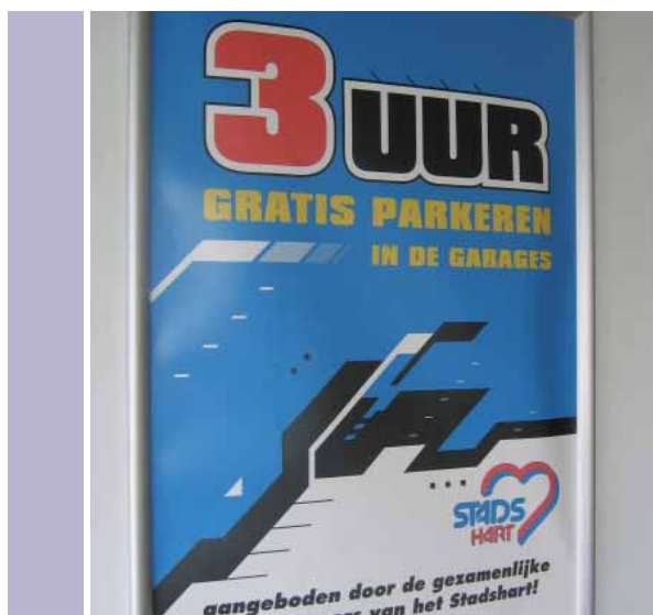
Zoetermeer: Eerste drie uur gratis parkeren.

Bij winkelcentrum Leidsenhage in Leidschendam en de woonboulevards in Apeldoorn en Utrecht is het parkeren gratis. Bij Bovenlangs in Zoetermeer zijn de eerste drie uur gratis. Bij het Gelderlandplein in Amsterdam de eerste anderhalf uur. Verder kan in een aantal garages de eerste 15 minuten gratis geparkeerd worden: De Karperton in Alkmaar, de Koestraat in Amersfoort, de Langstraat in Arnhem. Opmerkelijk is dat bij een aantal garages het wel mogelijk is de eerste periodes gratis te kunnen parkeren, maar dat dit nergens staat aangegeven. Bij de overige garages moet vanaf de eerste minuut betaald worden. In driekwart van de garages is de klant direct het tarief voor één uur kwijt (zie Bijlage 1). Bij één uur en één minuut moet voor twee uur betaald worden. Het Platform vindt dit onacceptabel.